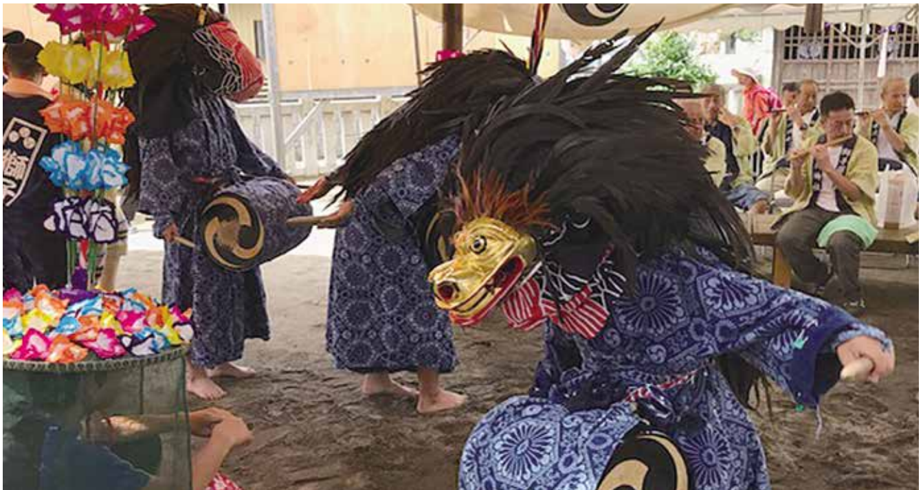
八潮市指定民俗文化財(無形民俗文化財)二丁目の獅子舞

二丁目の獅子舞は、七月第3日曜日の水川神社祭礼に奉納される。この獅子舞の始まりは、 めいれき 明暦元年(二六五五)頃であるといわれ、明治四十二年(一九〇九)までは、七月十五日上二丁目水川神社、七月十六日下二丁目稻荷神社、八月二日若柳稻荷神社での年3回の奉納であった。