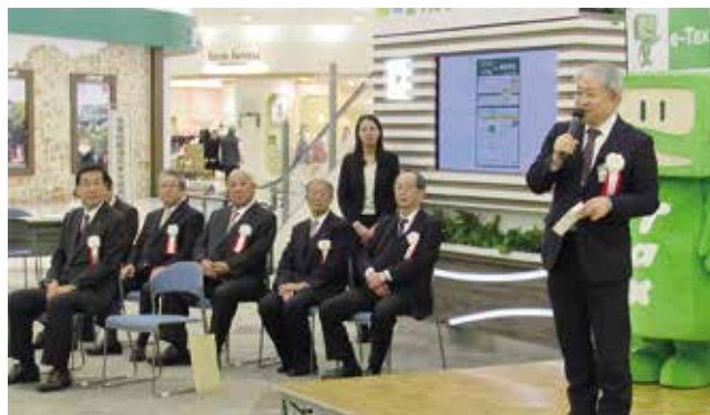
1月27日 越谷税務署 e-Tax パブリシティ開催 (関係団体代表出席) 広瀬署長ご挨拶