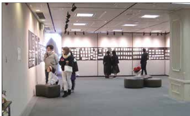
2月1日 税の絵はがき展示会（ギャラリー）ご来場者風景