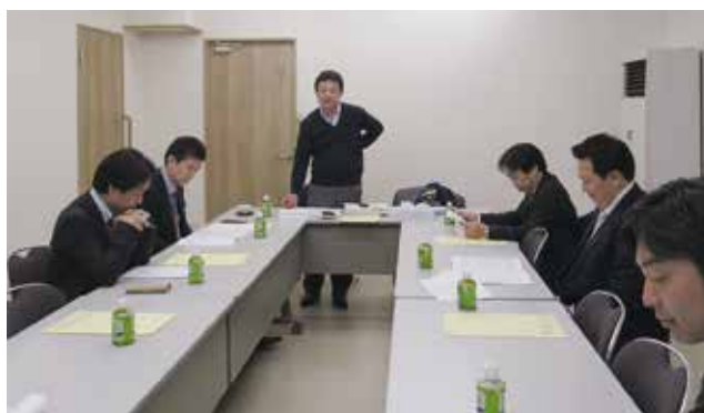
2月13日 青年部会 役員会（事業計画）若海部会長挨拶