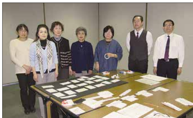
1月31日 税の絵はがき全作品展示作業参加者集合写真