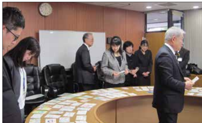
税の絵はがき選考会参加者集合写真 及び 選考会風景