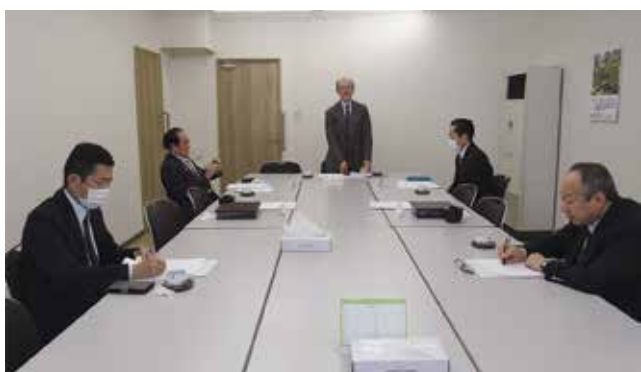
3月13日 研修委員会（事業計画）程田委員長挨拶