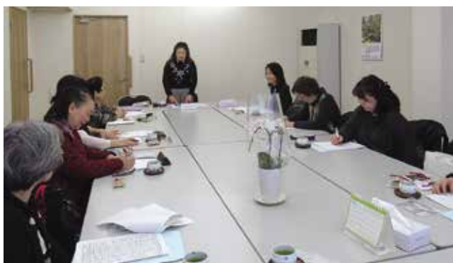
3月6日 女性部会役員会（事業計画）林部会長挨拶