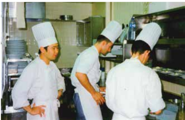
フランスでの修業当時の風景