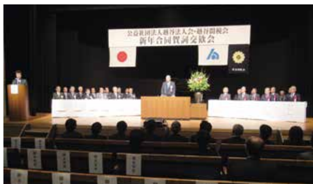
1月10日 越谷法人会・越谷間税会 新年合同賀詞交歓会 国歌斉唱 主催者・ご来賓集合写真