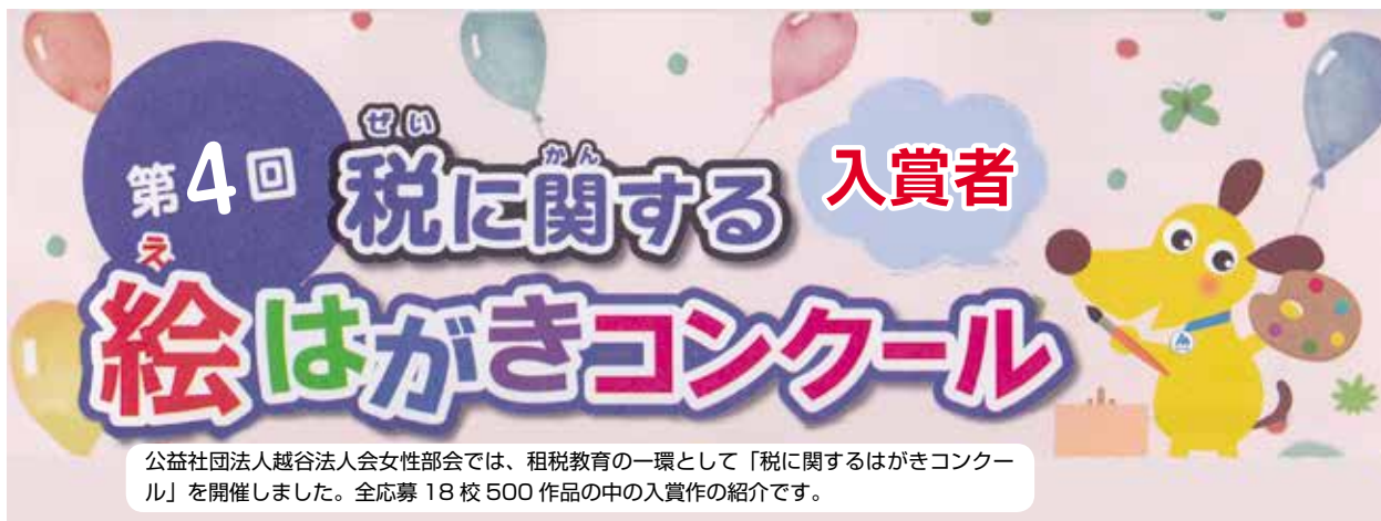
公益社団法人越谷法人会女性部会では、租税教育の一環として「税に関するはがきコンクール」を開催しました。全応募 18校 500 作品の中の入賞作の紹介です。

今後も対象校を増やし継続して取り組み予定ですので、皆様のご支援ご協力をお願いいたします。