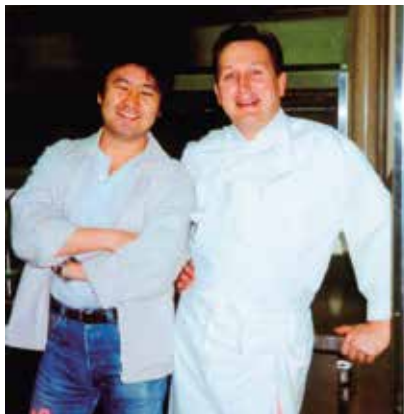
フランスでの修業当時の風景

お互いさまの精神で、売る側も買う側もリスペクトし合つて気持ちよくやり取りができればいいなと思います。